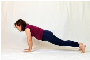
5. Atem anhalten